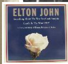
Erinnerungen an die große Zeit der Musikproduktion