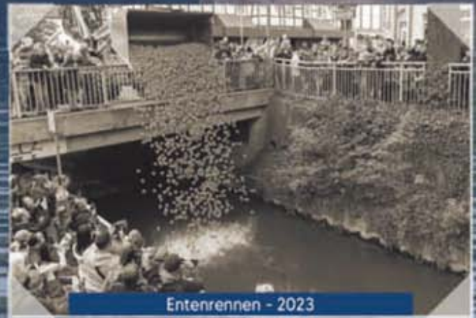
Entenrennen - 2023

Ausstellung vom 10. August bis 12. Oktober 2025