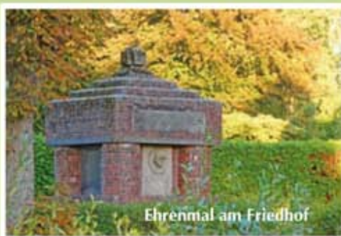
Ehrenmal am Friedhof