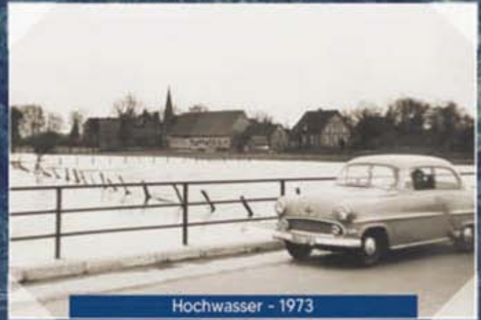
Hochwasser - 1973