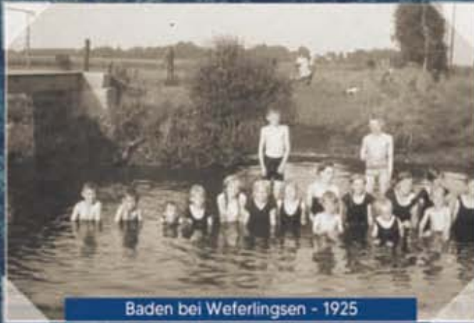
Baden bei Weferlingsen - 1925