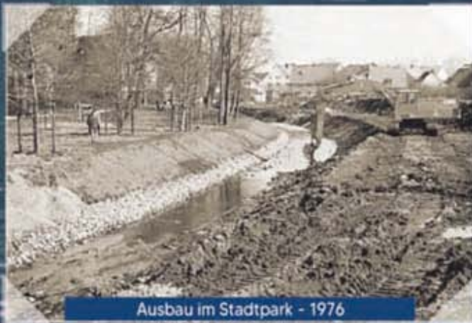
Ausbau im Stadtpark - 1976