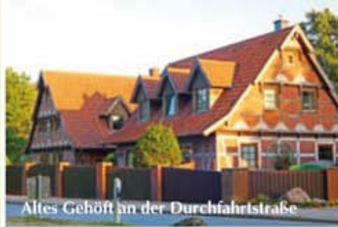
Altes Gehöft an der Durchfahrtsstraße