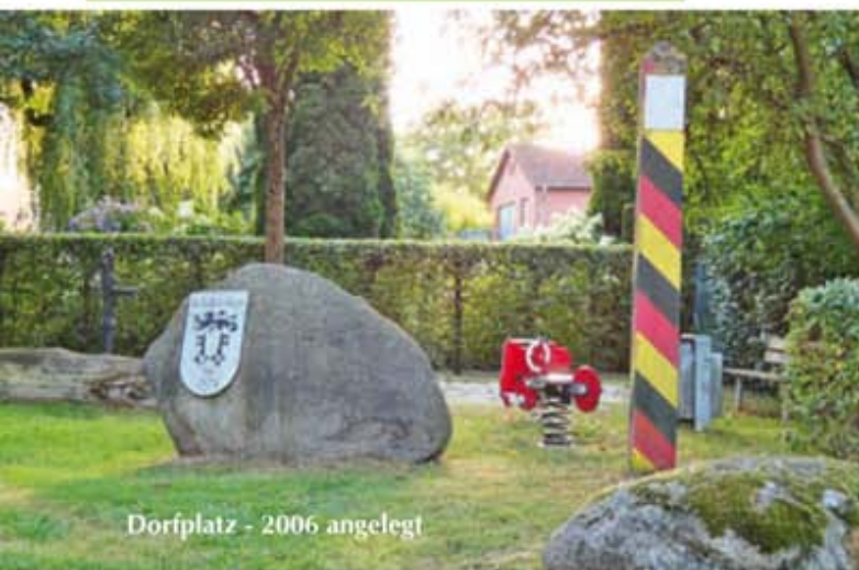
Dorfplatz - 2006 angelegt