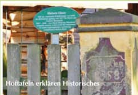
Hoftafeln erklären Historisches