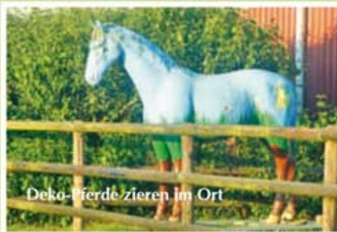
Deko-Pferde zieren im Ort