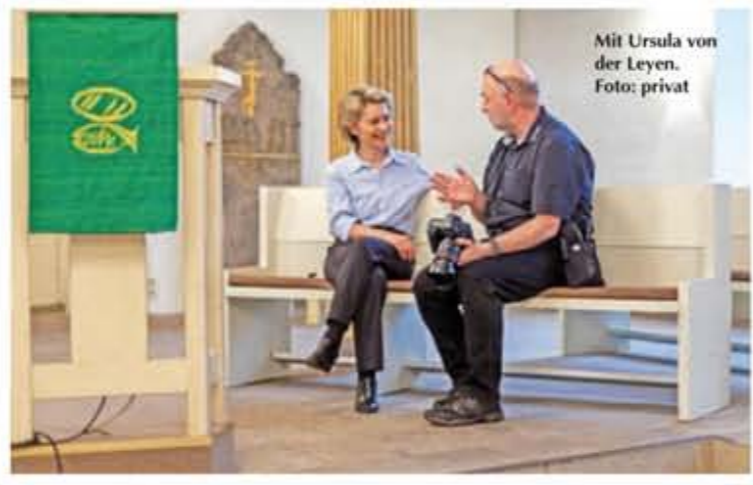
Mit Ursula von der Leyen.