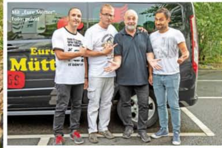
Mit „Eure Mütter“