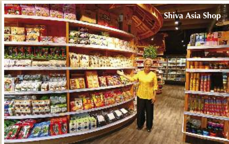
Shiva Asia Shop