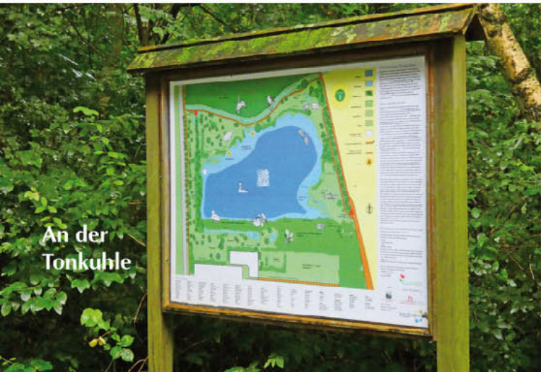
An der Tonkuhle